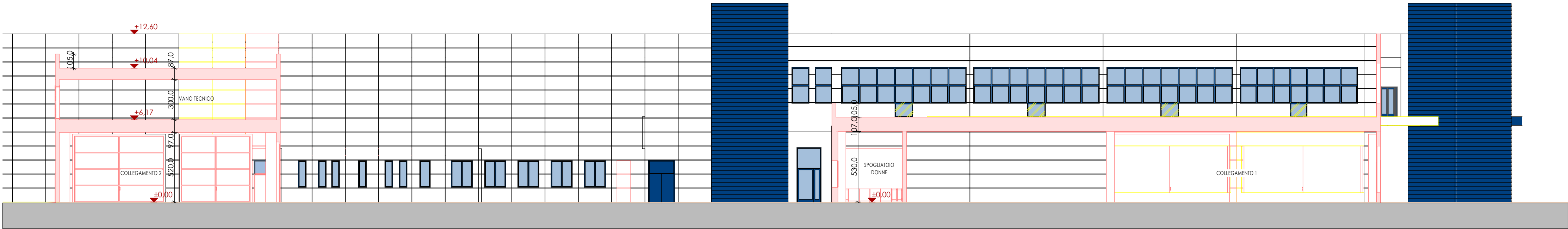
MAGAZZINO A ESISTENTE - PROSPETTO SUD